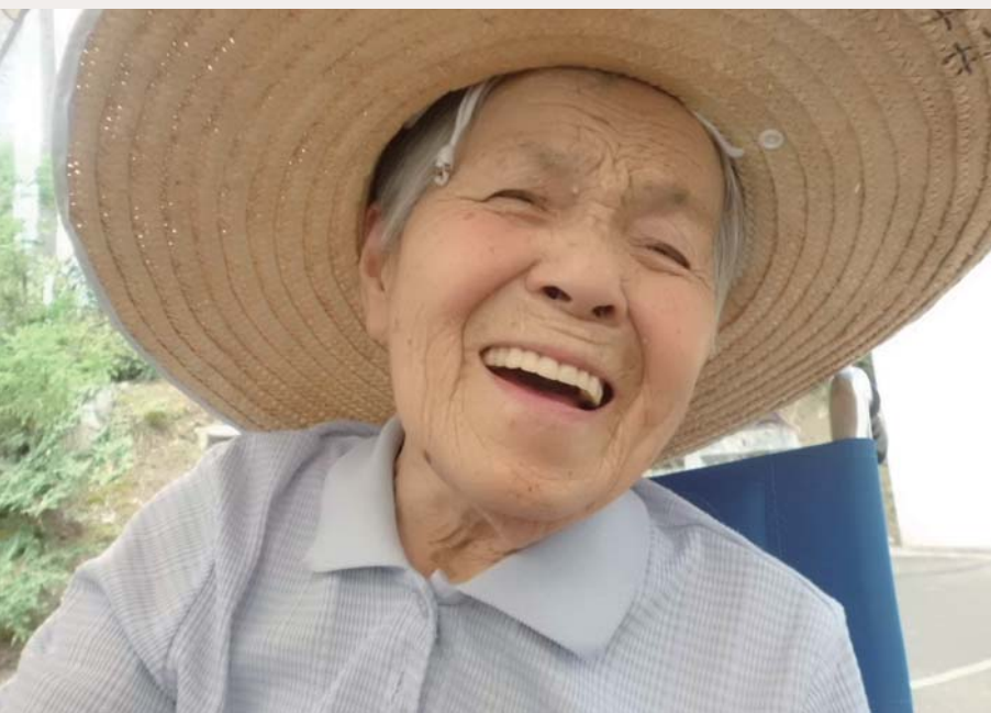
《平成27年度介護の日フォトコンテスト優秀作品》