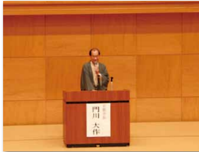
門川大作京都市長より応援メッセージ