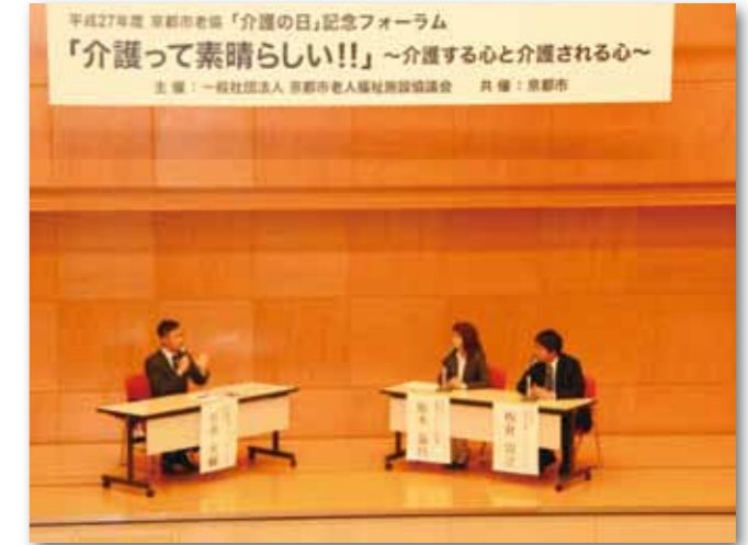
ハートメッセンジャー実践報告