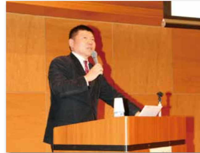
三好明夫教授記念講演