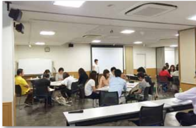
ファーストステップ研修