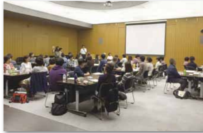
チームリーダー研修