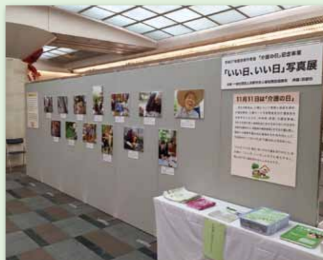
「いい日、いい日」写真展